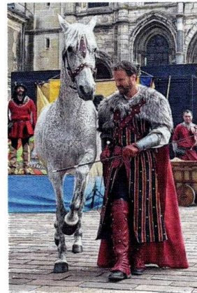
Lors du lancement des Fêtes johanniques, une démonstration de dressage était proposée aux visiteurs sur le parvis de la basilique Saint-Remi.