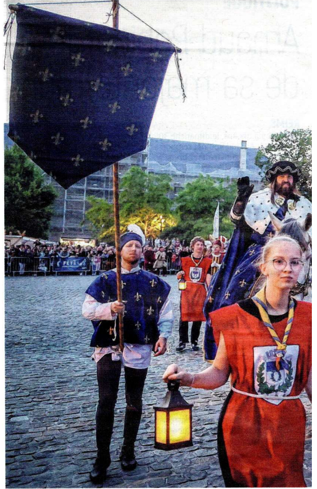
Hier soir, la grande parade permettait de revivre l'entrée dans la ville de Charles VII et de Jeanne d'Arc, accompagnés par moult personnages. Stéphanie Jayet

battront le fer tandis qu'au square Jeanne d'Arc, les enfants pourront jouer les apprentis fondeurs. Musique médiévale et jonglerie animeront les cours Anatole France, et à deux pas de là, rue Robert de Coucy, il sera possible de prendre de la hauteur grâce à la tour d'escalade. Sur le parvis de Notre-Dame, les lanceurs de drapeaux se partagent l'espace avec une horde festive pour une musique en mouvement. Un voyage dans le temps assuré ! ■