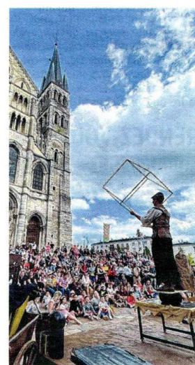
Les spectacles gratuits s'enchaînent encore ce dimanche sur le parvis de la basilique. A.R.