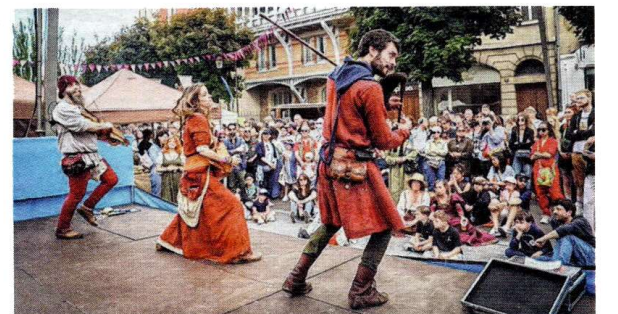
Cornemuse, vielle à roue, nyckelharpa et percussions ont mis de l'ambiance cours Anatole-France. S.J.