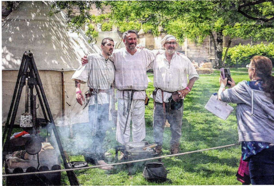
Des campements et des reconstitutions historiques sont à découvrir derrière la cathédrale dans le jardin Henri-Deneux. Stéphanie Jayet

REIMS Dyez ! Dyez ! Les Fêtes johanniques se poursuivent ce dimanche autour de la cathédrale et de la basilique Saint-Remi.