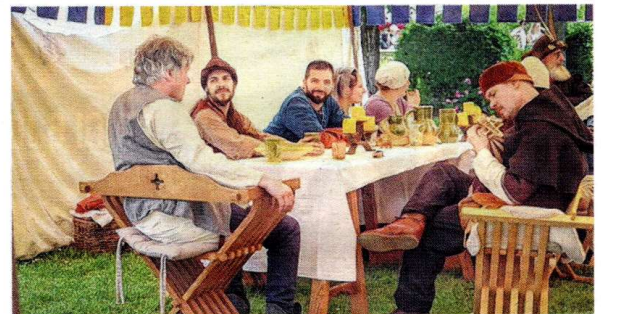
C'est l'heure de la pause, forcément revigorante, pour ces artisans, commerçants, tailleurs de pierre, musiciens, potiers, apothicaires, calligraphes et autres forgerons. Stéphanie Jayet