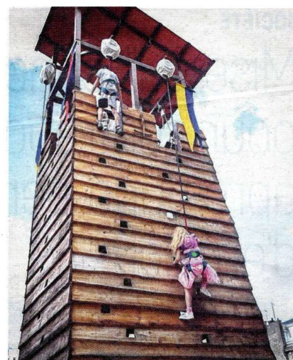
Revêtus d'un harnais, de nombreux chevaliers, damoiseaux, guerrières et princesse ont relevé le défi d'escalader cette tour médiévale. Stéphanie Jayet