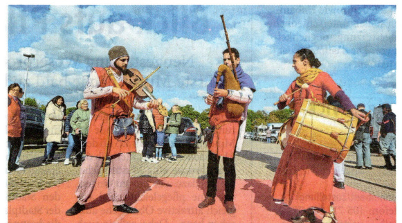
Am Eingang begrüßten Künstler die Besucher mit Musik auf historischen Instrumenten.