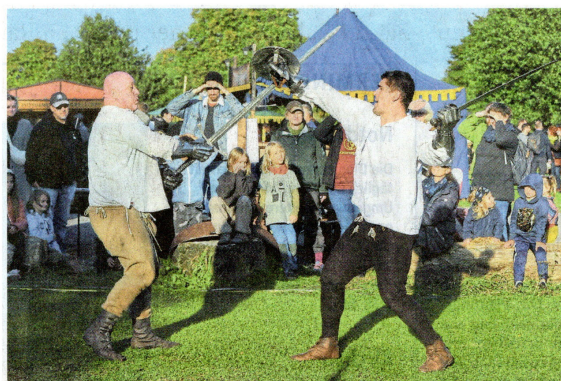
So etwas bekommt man nicht alle Tage zu sehen: Filmreife Schwertkämpfe auf Kanzlers Weide.