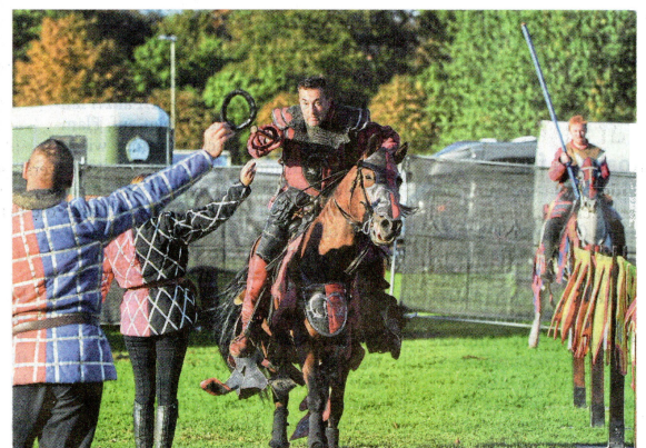
„Reenactment“ (englisch für Nachstellung) nennt man die möglichst authentische Inszenierung geschichtlicher Ereignisse