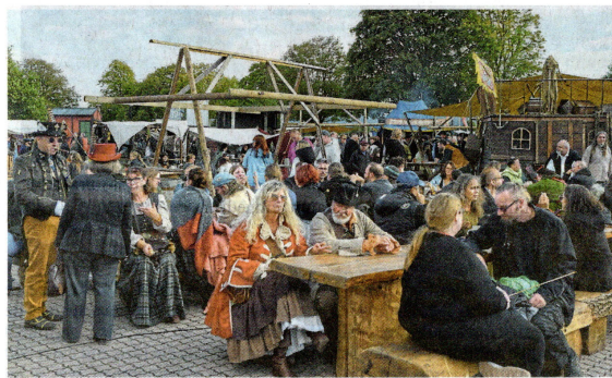
Händler, Phantasiegestalten und Besucher mischen sich zu einem insgesamt recht bunten Völkchen.