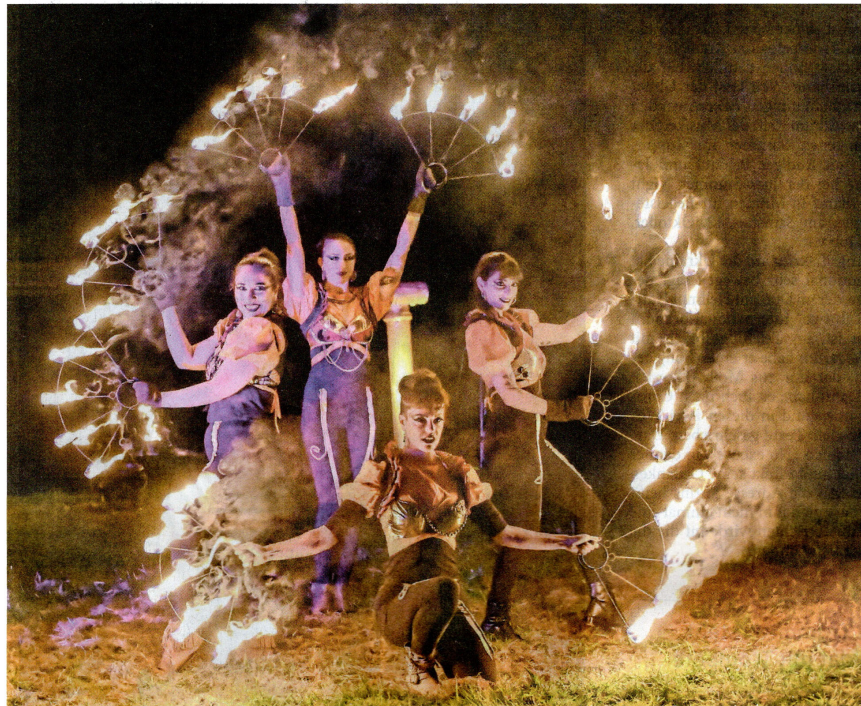
Eine Feuershow faszinierte die Besucher am Samstagabend.